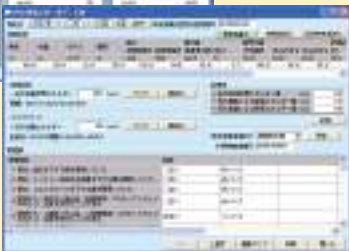
▲特定健康診査画面