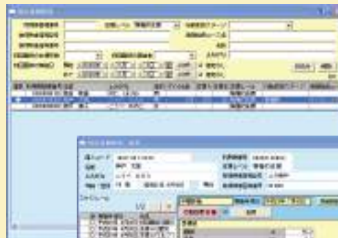
▲特定保健指導一覧画面