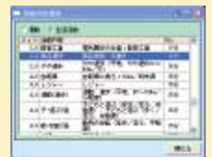
▲活動内容選択画面