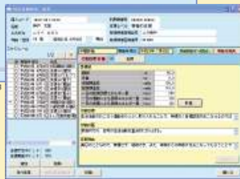
▲特定保健指導一指導画面